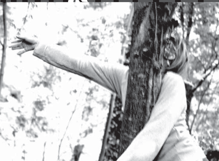
La Cie du Ruisseau

Quel est le chemin parcouru entre la naissance d'une idée et la création d'une pièce chorégraphique ? Deux chorégraphes, Aude Bertrand et Clara Cornil, nous dévoilent les éléments qui entourent leur travail de création. Il faut souvent des années de cheminement pour aboutir à un spectacle d'une heure.